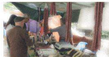
FIRES I MERCATS AL CARRER

GUIA DE PRÀCTIQUES D'HIGIENE PER A LA VENDA D'ALIMENTS