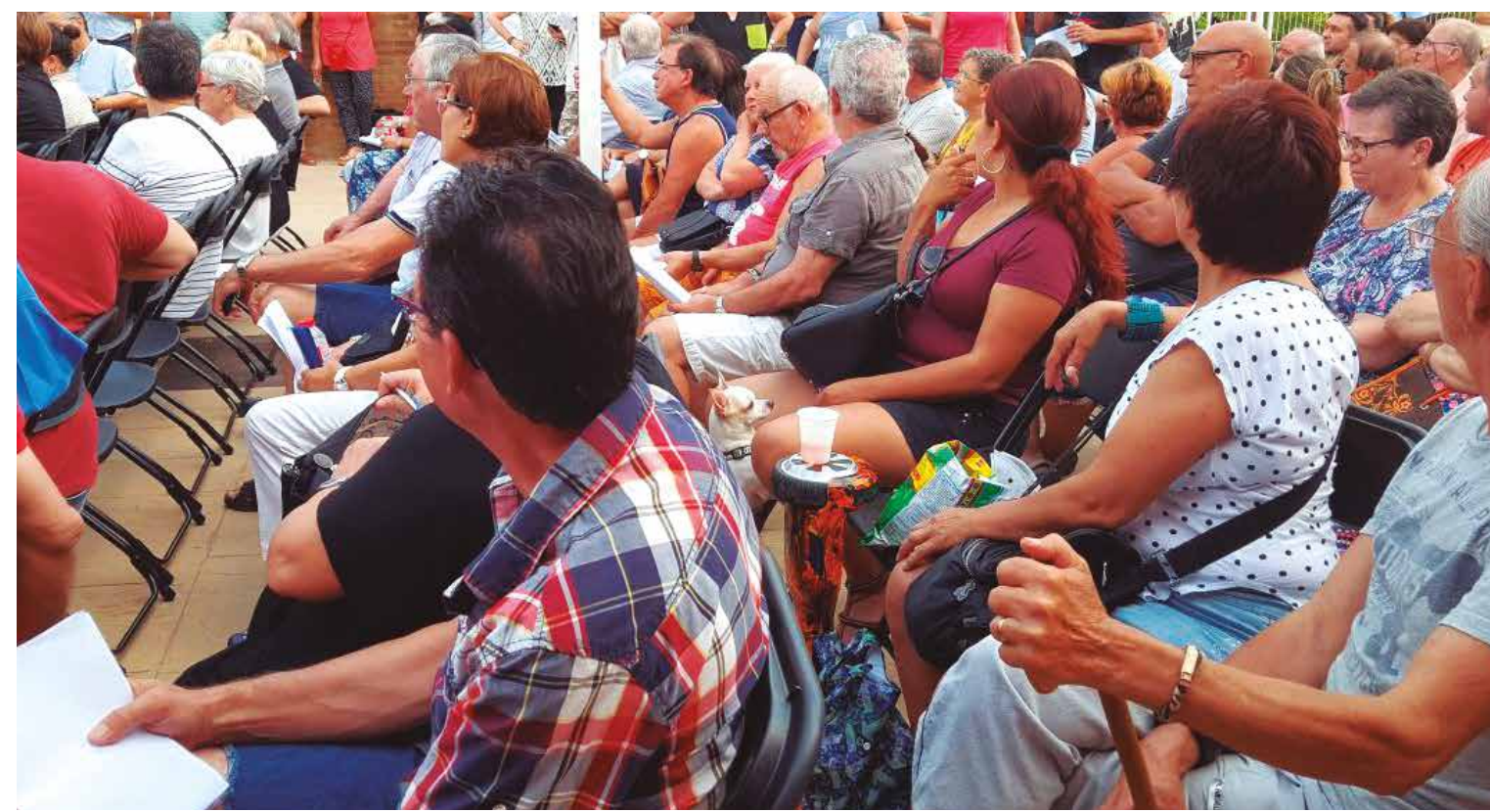
Un total de 287 persones van participar a la trobada veïnal de l'Escola Santa Coloma

L'octubre del 2016 ens va arribar la notícia que Santa Coloma rebria 15 milions de la Unió Europea per fer realitat diversos projectes, entre els quals, la urbanització del passeig de la Salzereda.