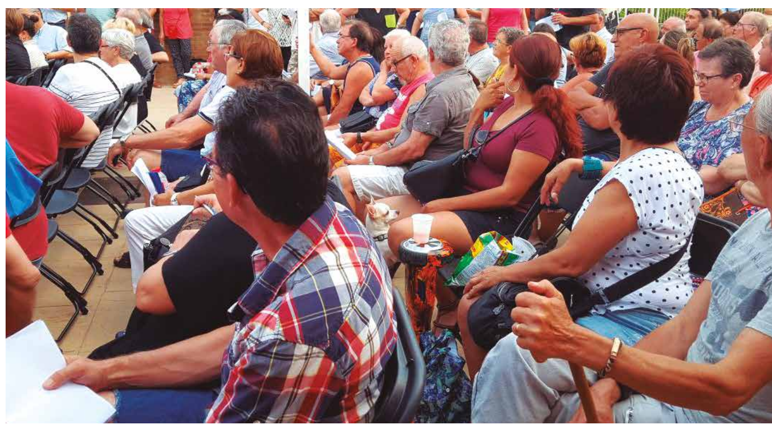
Un total de 287 personas participaron en la reunión de vecinos y vecinas en la Escuela Santa Coloma

En octubre del 2016 nos llegó la noticia de que Santa Coloma recibiría 15 millones de la Unión Europea para desarrollar diversos proyectos, entre ellos, la urbanización del Paseo Salzereda