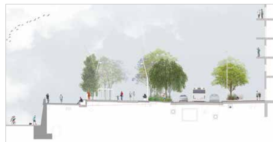
Perfil de la secció

El Model 1 connecta la nova zona de passeig directament amb el Parc Fluvial