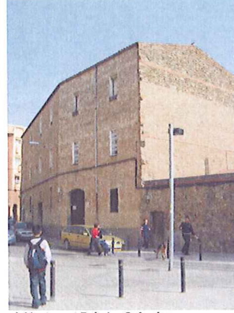
pl. Montserrat Roig / c. Safareigs