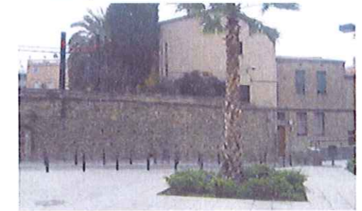
pl. Montserrat Roig