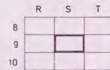
Gráfico situacion de la hoja 1.2000