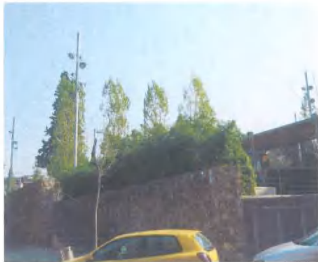
Jardins Ernest Lluch