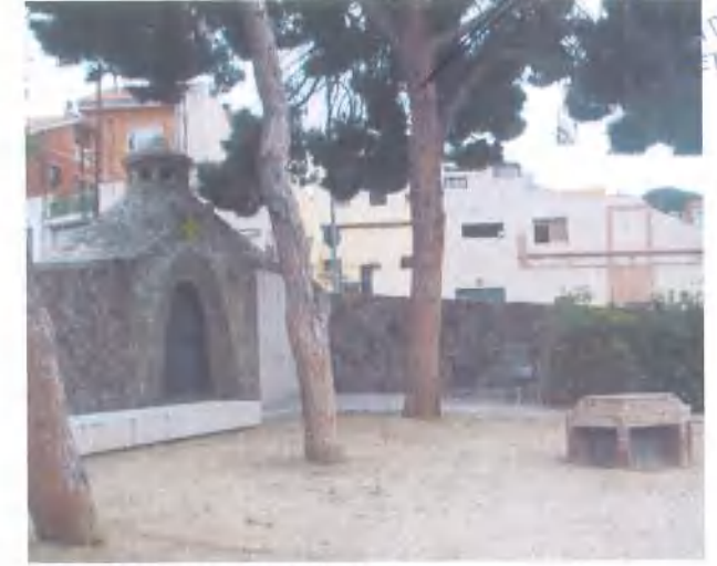
Situació respecte altres elements

Cronologia: Inauguració del cementiri: 1.861 / Construcció del Panteó: Principis del segle XX / Urbanització dels jardins: 2.003