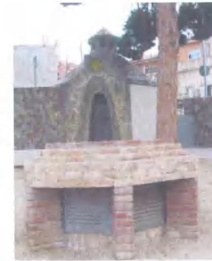
Situació respecte altres elements