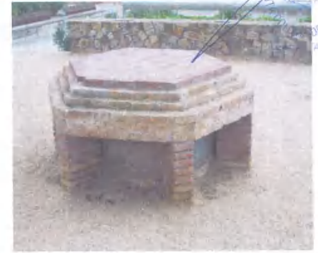
Exterior de la claraboia

Cronologia: Inauguració del cementiri: 1.861 / Construcció del Panteó: 1.909 / Urbanització dels jardins: 2.003