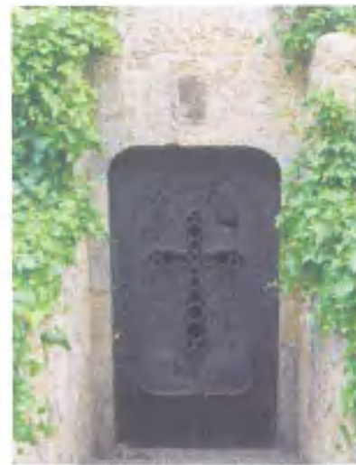
Porta de ferro forjat