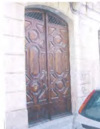
Elements de la façana principal