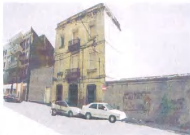
Fotomuntatge del carrer Pedró

Localització: Carrer Pedró, 24 (estat actual) - Carrer Pedró, 14* (proposta de trasllat)