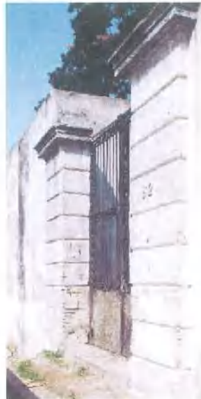
Estat previ al trasllat