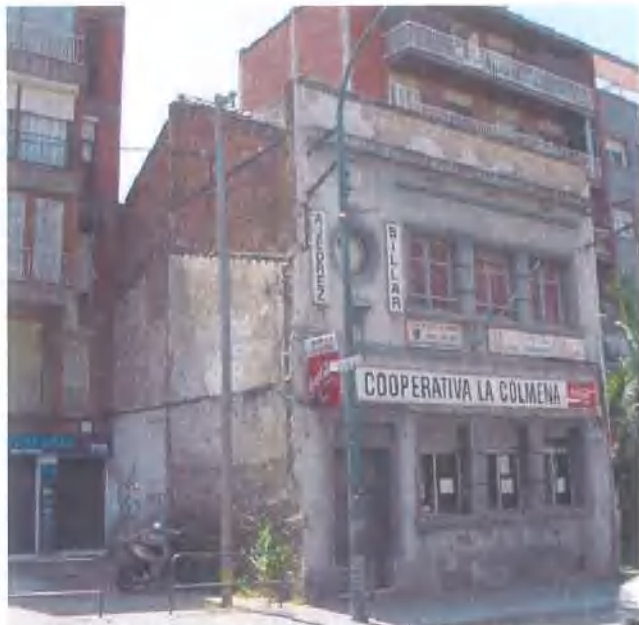
Façana de la Rambla de Sant Sebastià (estat previ)

Denominació: Cooperativa "La Colmena" Localització: Carrer de Sant Josep, 3