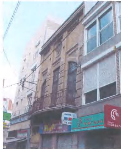
Façana del carrer Sant Josep (estat previ)