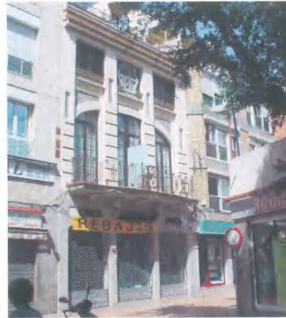
Façana del carrer Sant Josep (estat actual)