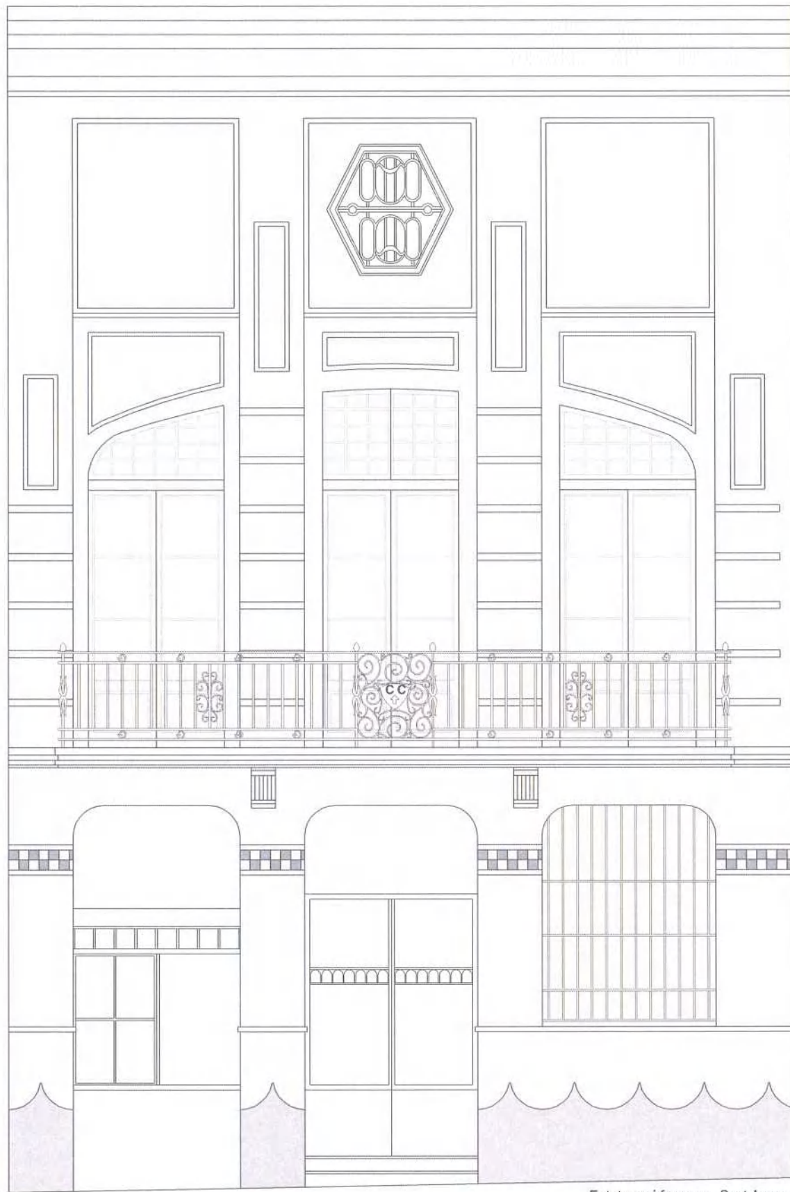
Estat previ façana c. Sant Josep