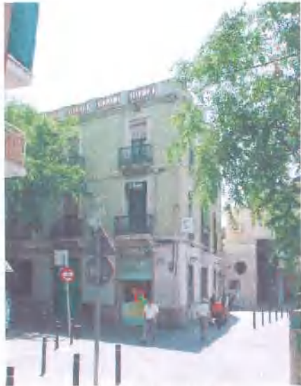
Façana principal al Carrer Major

Denominació: Can Met Localització: Carrer Major, 37-39