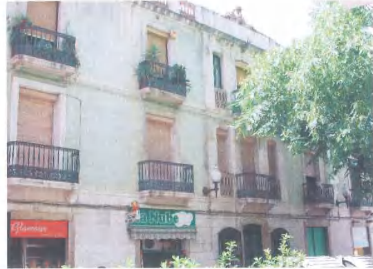
Façana al Carrer de Sant Carles