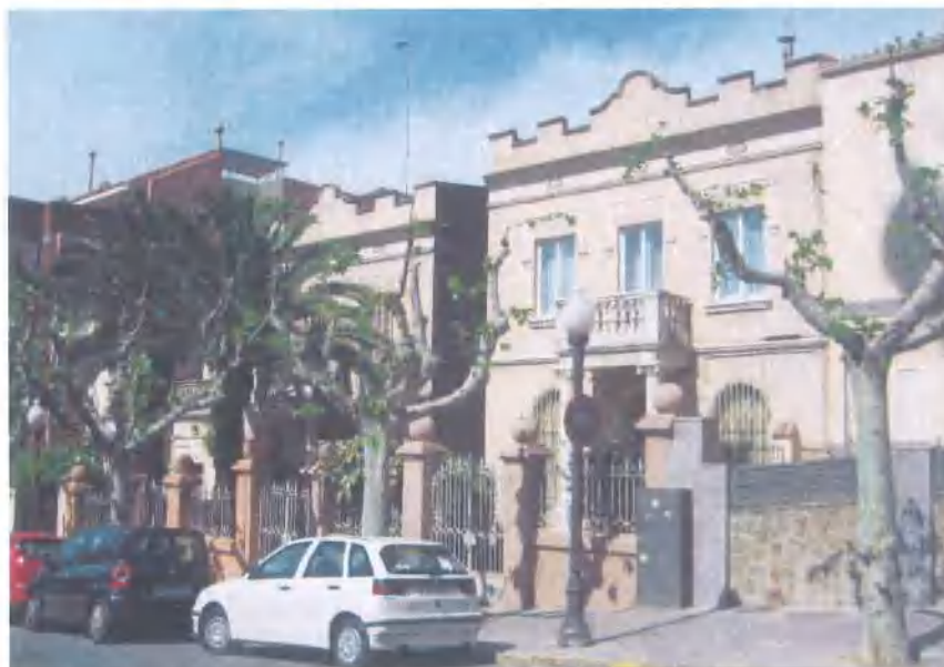
Conjunt de cases

Denominació: Cases Localització: Passeig de Mossèn Jaume Gordi, 29 i 31