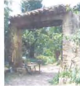
El Portal interior