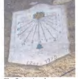
El rellotge de sol

Cronologia: Origen: segle XVI / Ampliació: segle XVIII