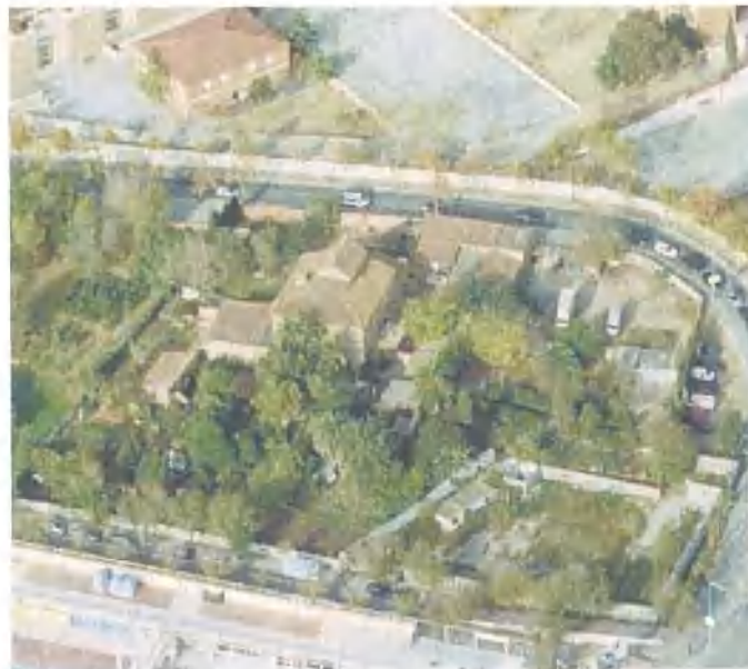
Vista aèria de la finca