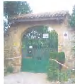
El Portal d'accès