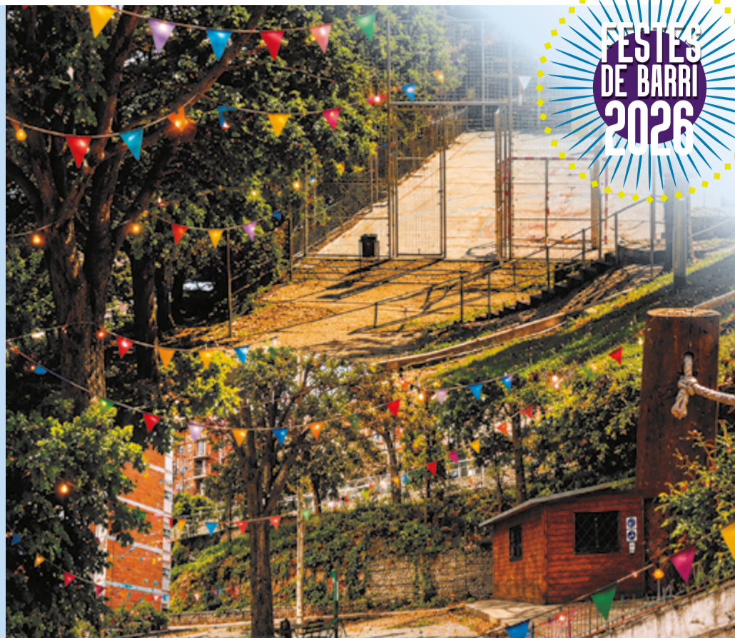
Tota la programació a www.gramenet/festesdebarri .

Dimecres, 24 de juny (11.30 h) començaran les activitats amb una masterclass de zumba amb Hanna. A les 12 h, hi haurà el lliurament de premis i, a les 13.30 h, l'actuació de Heavytanos amb la millor música heavy i rumba. El programa de festes finalitzarà amb un gran paella popular a les 14.30 h.