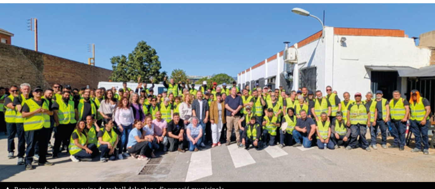
▲ Benvinguda als nous equips de treball dels plans d'ocupació municipals.

Pel que fa als plans d'ocupació de l'Àrea Metropolitana de Barcelona (AMB), s'ha contractat recentment 12 persones, que faran treballs de suport a diferents serveis municipals, destacant els relacionats amb l'educació ambiental, Eco-metròpoli i agents cívics.