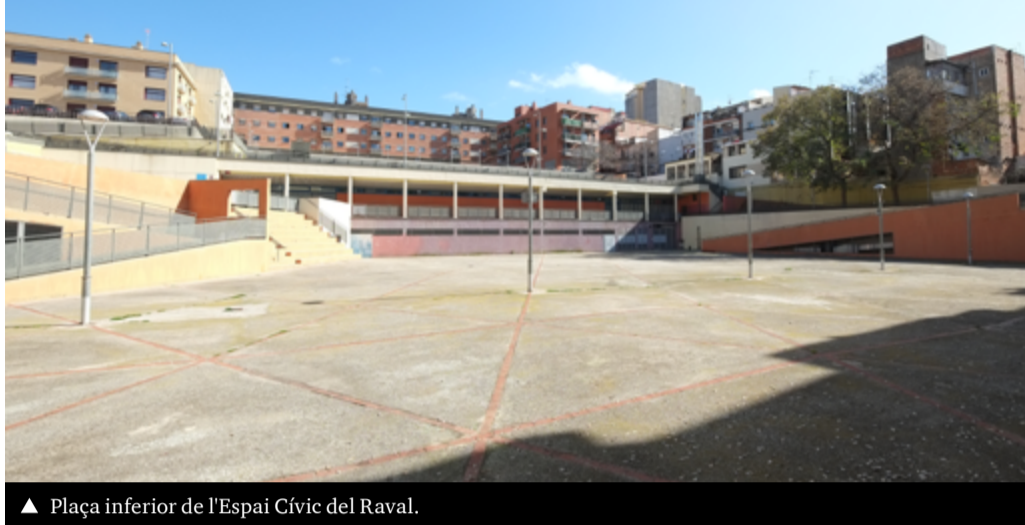
▲ Plaça inferior de l'Espai Cívic del Raval.

► El trasllat s'emmarca en el projecte global de la transformació de l'anomenat Espai Cívic del Raval, un interior d'illa en què es rehabilitarà la plaça inferior. Es tracta d'un espai delimitat per l'av. de la Generalitat i els carrers de Sant Jordi i Pau Claris on se situa el Centre Esportiu Raval.