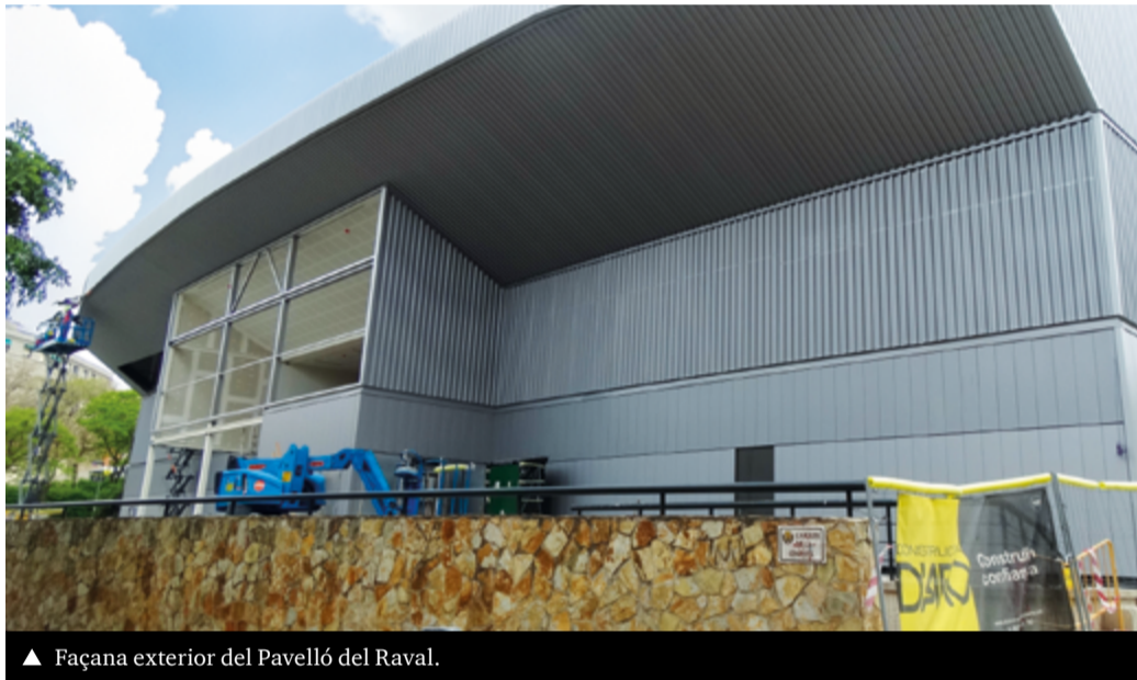
▲ Façana exterior del Pavelló del Raval.

► El Pla de millora de les instal·lacions esportives, amb una inversió de gairebé 30 milions d'euros, s'inclou en el marc del Pla municipal d'inversions 2025-2030. L'objectiu de l'Ajuntament és crear nous equipaments, millorar els actuals, aconseguir més eficiència energètica en unes instal·lacions més sostenibles i dotar-les d'una millor accessibilitat.