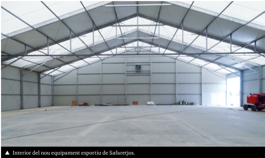
▲ Interior del nou equipament esportiu de Safaretjos.

La captació de fons europeus i de recursos d'altres administracions impulsa la transformació dels espais