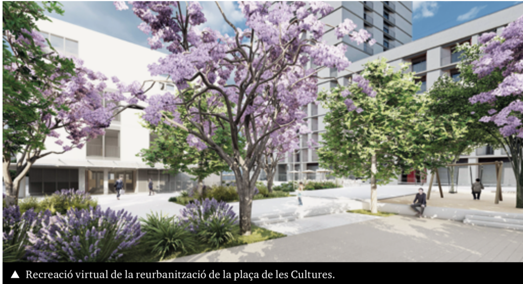
▲ Recreació virtual de la reurbanització de la plaça de les Cultures.

► El projecte transformarà aquest àmbit en un espai més confortable, accessible i verd, millorant la qualitat de l'espai públic i la connexió entre els barris, i integrant l'entorn de la nova comissaria. Entre les actuacions a realitzar destaca l'ampliació de voreres, la renovació del paviment de la calçada i del clavegueram amb un nou col·lector, el soterrament dels subministraments bàsics, i la creació d'una nova zona de jocs infantils i un espai de refugi climàtic.