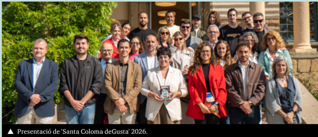
▲ Presentació de 'Santa Coloma deGusta' 2026.

Enguany, es manté als locals de restauració participants l'oferta especial de tapes, menús i dolços —en uns dies i