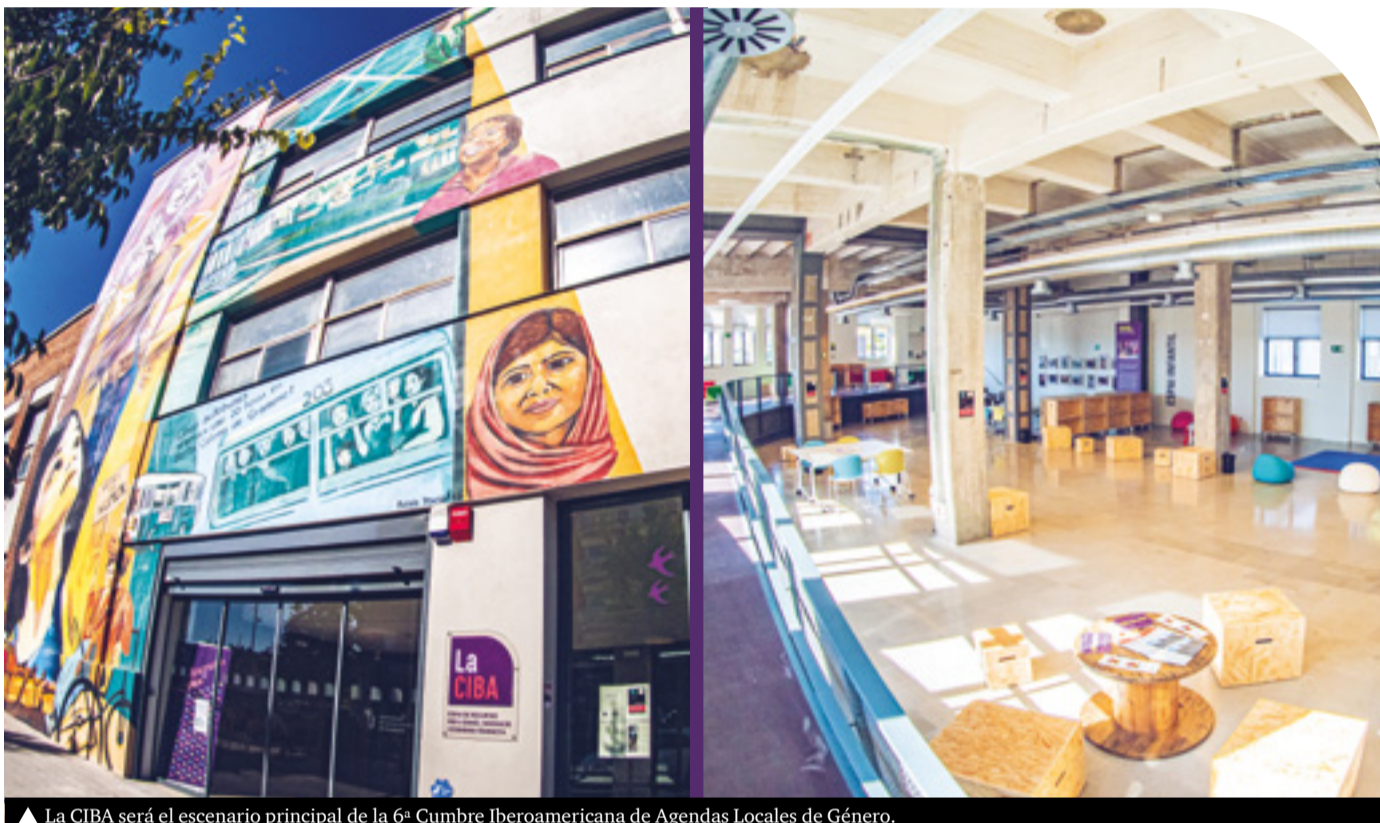
▲ La CIBA será el escenario principal de la 6ª Cumbre Iberoamericana de Agendas Locales de Género.

La ciudad se consolida como referente internacional en políticas de igualdad de género