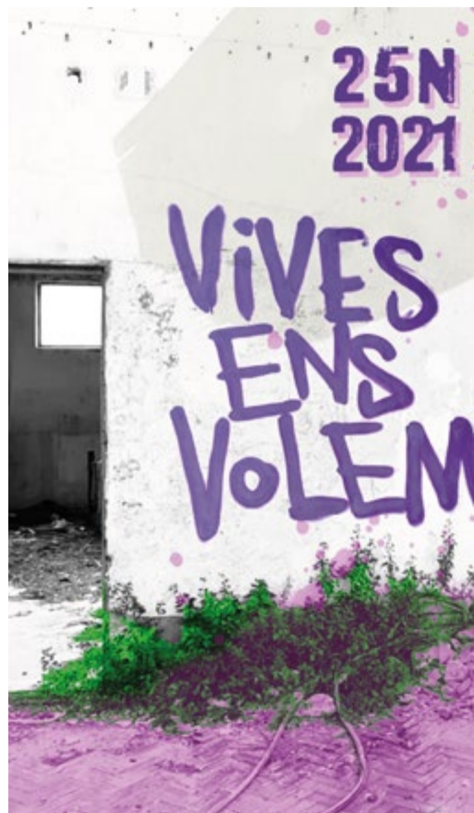
El programa es va inaugurar el passat 2 de novembre, amb la concentració mensual que es fa cada primer dimarts de mes (20 h) a la plaça de la Vila, per denunciar els feminicidis. En aquestes trobades es llegeix el nom de totes les dones assassinades.

Una altra de les activitats destacades serà «Santa Coloma, Xarxa Violeta», que tindrà lloc el 18 de novembre (18 h) a La CIBA. Aquest projecte innovador es va presentar el 2019 per crear espais segurs contra les violències masclistes i lgbtífobiques, en col·laboració amb 60 establiments de la ciutat, la majoria locals d'oci nocturn. Actualment, n'hi participen més de 250, gràcies a la incorporació de nombrosos serveis essencials de proximitat, com comerços o farmàcies, convertint Santa Coloma en un referent en la prevenció de les violències masclistes.