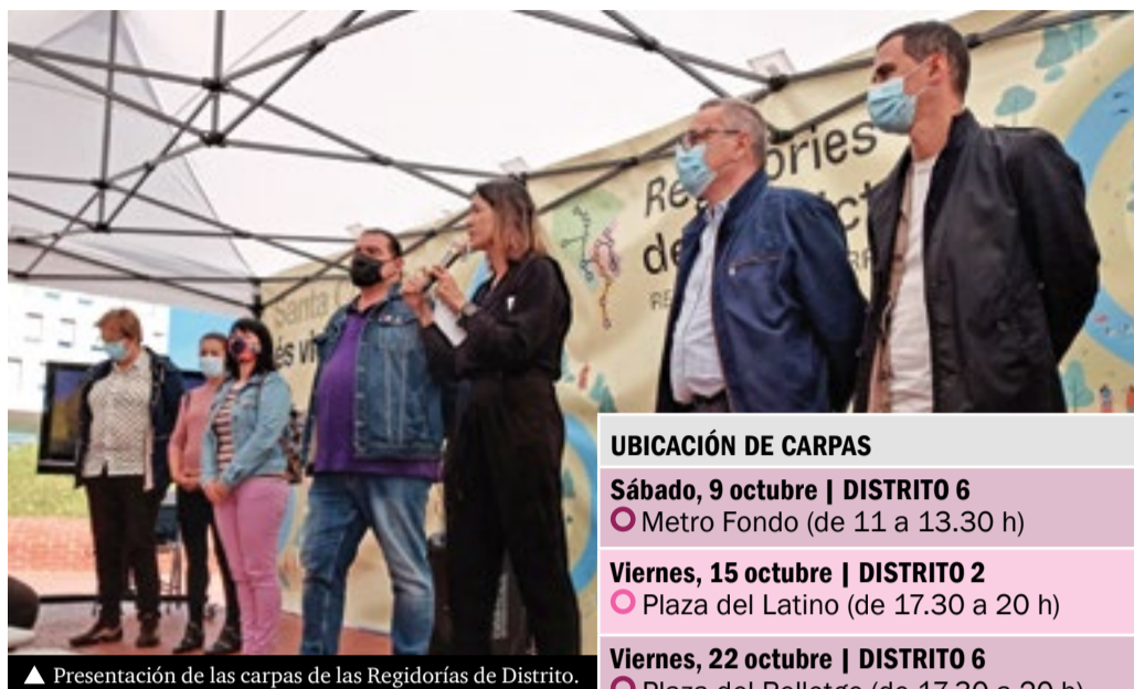
▲ Presentación de las carpas de las Regidurías de Distrito.

El Ayuntamiento retoma esta actividad después de que se hayan gestionado telemáticamente más de 400 incidencias y sugerencias ciudadanas desde el circuito de gestión directa de las diferentes regidurías durante la pandemia.