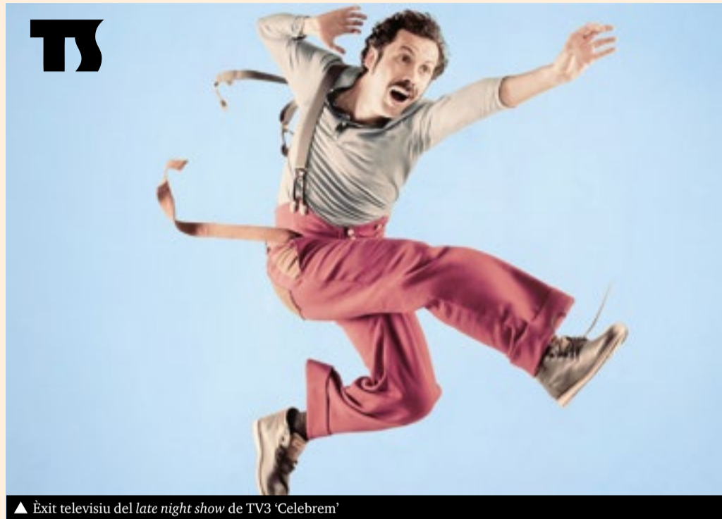
▲ Èxit televisiu del late night show de TV3 'Celebrem'

«Calma» porta l'espectadora i l'espectador a gaudir d'una experiència per moments còmica, per moments poètica. Amb el clown com bandera i a través dels titelles, el gest, les ombres o la música; farà qüestionar al públic el dia a dia i el seu viatge vital. Si val la pena córrer tant, si estem fent el que realment ens omple, i en definitiva: si volem seguir així o volem canviar-ho.