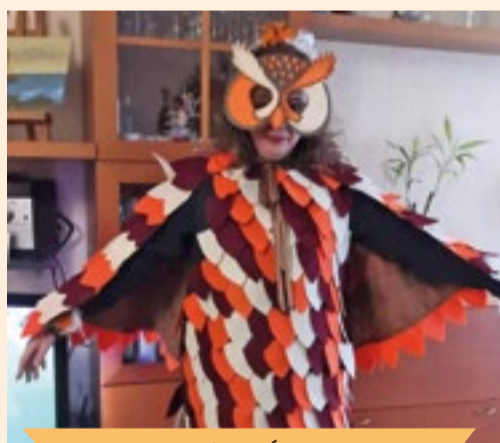
La més ARTÍSTICA

► Us presentem les tres disfresses guanyadores del concurs virtual convocat pel Rei Carnestoltes amb motiu del Carnaval 2021, escollides per la Comissió de Festes. Podeu veure el vídeo recopilatori de totes les persones que hi han participat al canal Ikonograma de YouTube.