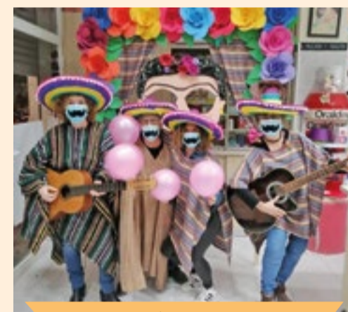
La més MARXOSA