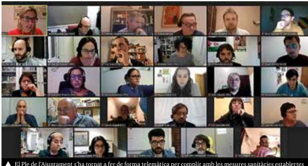
▲ El Ple de l'Ajuntament s'ha tornat a fer de forma telemàtica per complir amb les mesures sanitàries establertes

El contracte s'ha adjudicat novament a l'empresa Idoia Natura, SL, per 16,6 milions (IVA inclòs), amb una durada de quatre anys. Com a novetat, s'ha inclòs la capacitat d'intervenció en urgències en un màxim de 12 hores.