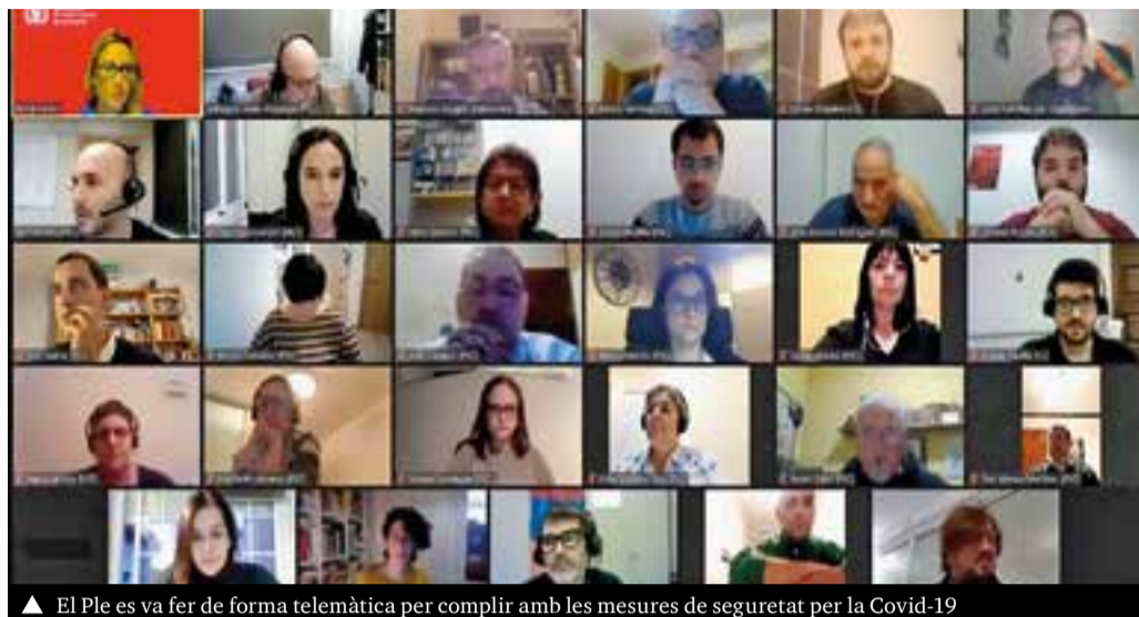
▲ El Ple es va fer de forma telemàtica per complir amb les mesures de seguretat per la Covid-19

Respecte a les mesures que s'incorporaran en l'aprovació definitiva de les ordenances, hi haurà la reducció de mercats i mercats no sedentaris , actualment pendents de negociació amb els afectats. També hi ha altres propostes del Pacte que no han estat incorporades, perquè la corporació ja disposa de mecanismes equivalents d'ajudes al sector.