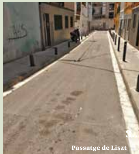
Passatge de Liszt