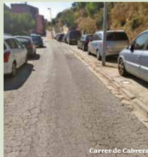
Carrer de Cabrera