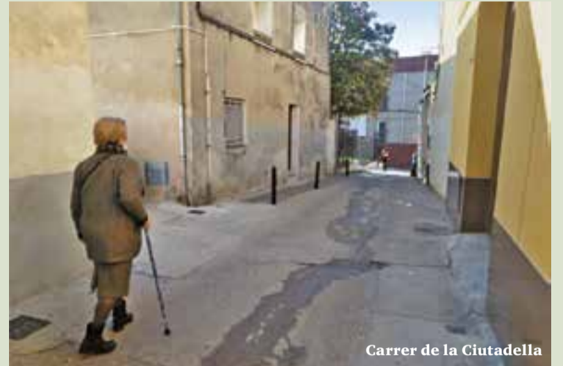
Carrer de la Ciutadella