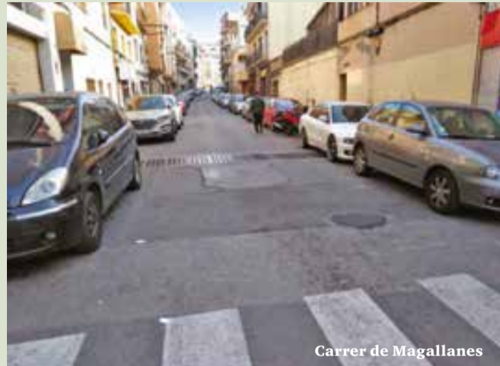
Carrer de Magallanes