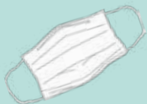
El uso de mascarilla es obligatorio

El Ayuntamiento llama a la colaboración de la ciudadanía para detener el aumento de casos de Covid-19 y recuerda que se han de respetar las recomendaciones básicas: usar la mascarilla (que es obligatoria), realizar el lavado frecuente de manos y mantener la distancia física de seguridad. RECUERDEN: