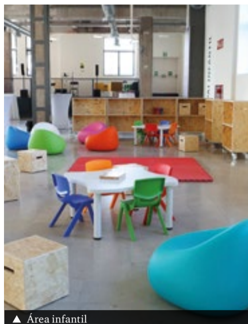
▲ Área infantil