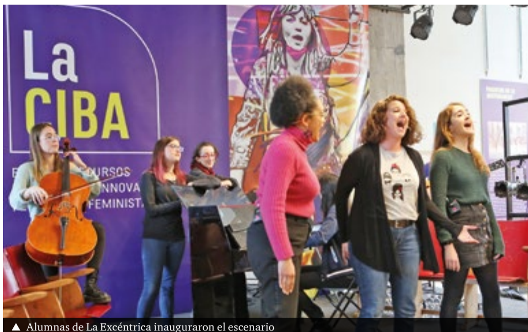
▲ Alumnas de La Excéntrica inauguraron el escenario