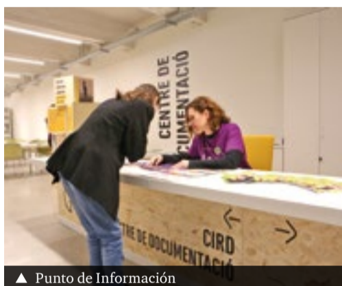
▲ Punto de Información