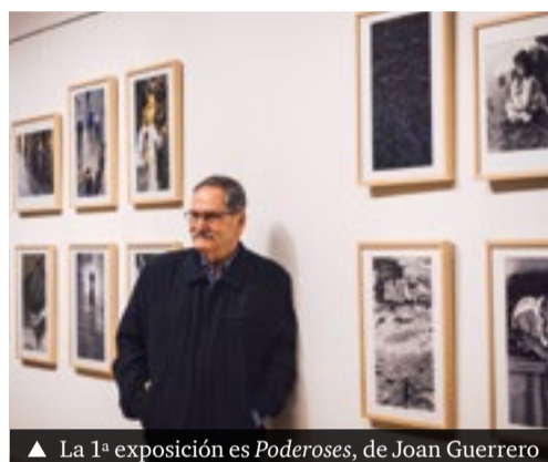
▲ La 1ª exposición es Poderosas, de Joan Guerrero