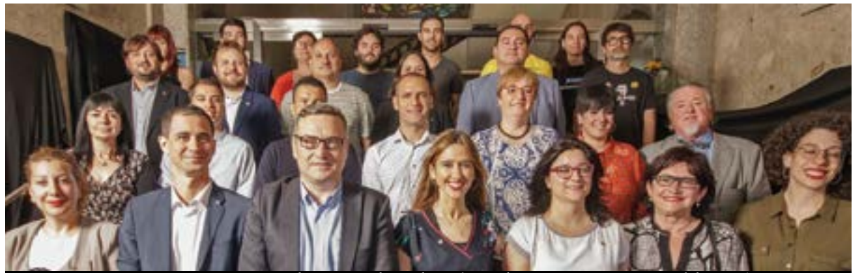
El consistori al complet amb totes les persones representants del PSC, C's, ECP i ERC. ▲