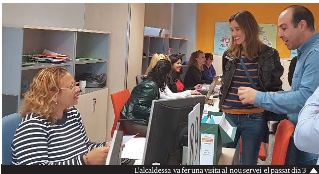
L'alcaldeessa va fer una visita al nou servei el passat dia 3

L'Oficina Local d'Habitatge està situada a l'empresa municipal Gramepark, a la plaça d'en José Cámara de la Hoz, s/n (el Raval). L'horari és dilluns i dijous de 9.00 a 15.00 h, dimarts i dimecres de 9.00 a 18.00 h i divendres de 9.00 a 14.00 h. El telèfon és el 93 385 94 56 i el lloc web, www.gramenet.cat/pobresae-nergetica .