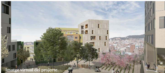
Imatge virtual del projecte.

Al maig del 2017, l'Ajuntament i l'Àrea Metropolitana de Barcelona (AMB), a través de l'IMPSOL, van signar un conveni per promoure un concurs d'idees amb la finalitat de rebre i explorar propostes que preveïessin re-