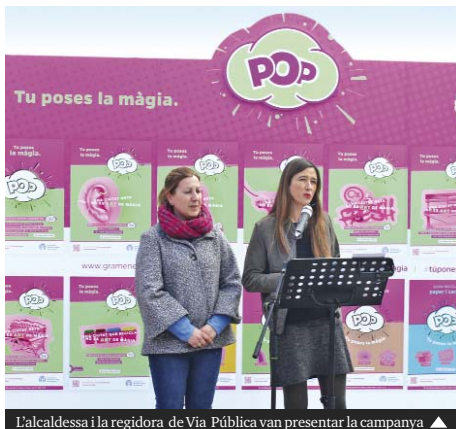
L'alcaldesa i la regidora de Via Pública van presentar la campanya ▶

La campanya serà especialment visible fins a mitjans d'abril en cartells al carrer, autobusos i metro, així com als contenidors i als vehicles dels serveis de recollida selectiva, i farà especial incidència en dues actituds incíviques per a les que la pròpia ciutadania ha reclamat a l'Ajuntament un esforç: l'eliminació dels excrements i pipis de gossos, que és la queixa més repetida pel veïnat, i la reducció i el reciclatge dels residus.