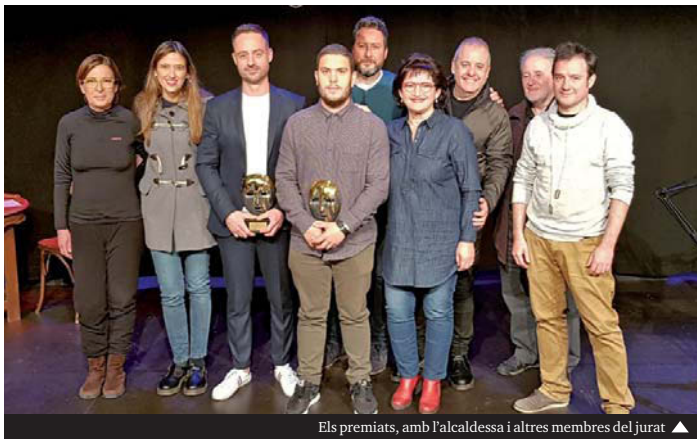
Els premiats, amb l'alcaldesa i altres membres del jurat ▲