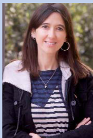
Núria Parlon Gil Alcaldesa de Santa Coloma de Gramenet