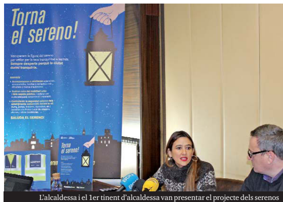
L'alcaldesa i el 1er tinent d'alcaldesa van presentar el projecte dels serenos

Els serenos aniran identificats i el seu horari laboral serà entre les 23.00 i les 7.00 h. S'habilitarà un telèfon de contacte per afavorir la comunicació entre aquest servei i el veïnat, que es donarà a conèixer properament. Per encàrrec de l'Ajuntament, el projecte el dirigirà Grameimpuls, que serà qui s'encarregui, amb la normativa habitual, de seleccionar les persones que s'han de contractar. La recuperació de la figura dels serenos no forma part dels projectes de millora de la seguretat ciutadana, sinó