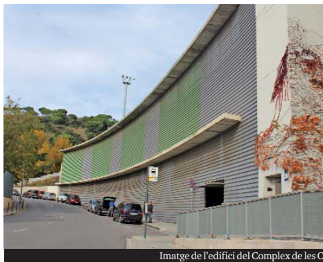
Imatge de l'edifici del Complex de les Oliveres i un moment de la presentació del projecte a càrrec de l'alcaldesa ▶

L'edifici del Complex de les Oliveres és molt lluminós, amb bones vistes i ben comunicat mitjançant transport públic. Actualment, està en desús i disposa de tres plantes d'uns 2.700 m 2 . En cadascuna hi ha 2.000 m 2 planificats per a aparcaments o trasters, i 700 m 2 per a altres usos. Així doncs, compta amb 2.100 m 2 per crear-hi el nou espai, que permetrà allotjar fins a 104 joves que vinguin a fer activitats esportives o a estudiar al Campus Universitari de l'UB a Torribera, entre d'altres.