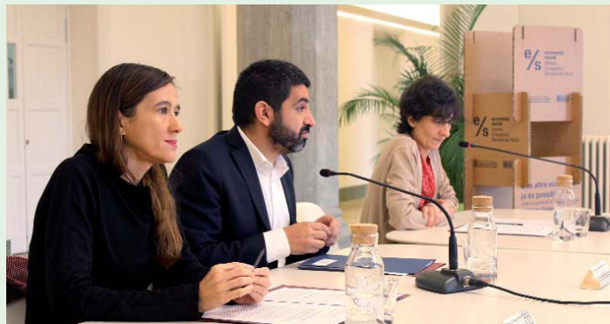
L'alcalde, el conseller de Treball i la coordinadora de l'Ateneu Barcelonès Nord, durant l'acte ▲