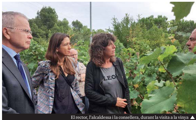
El rector, l'alcaldesa i la consellera, durant la visita a la vinya ▶

Aquest estudi permetrà la realització d'un informe tècnic que, en cas de ser positiu, serà la base per avaluar la possibilitat d'incloure aquestes quatre varietats entre els diferents conreus de la zona, així com la recuperació d'una activitat agrícola actualment residual. El projecte tindrà una durada de quatre anys i s'hi destinarà un pressupost aproximat de 48.000 €. Recentment, la Comissió Rectora del Consell Regulador de la DO Alella va aprovar la incorporació de Santa Coloma a la seva zona de producció.