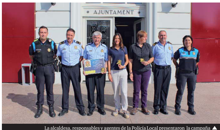
La alcaldesa, responsables y agentes de la Policía Local presentaron la campaña ▲