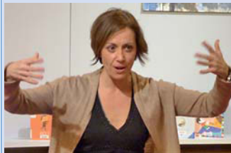
Lloc: Biblioteca Singuerlín (plaça de la Sagrada Família, s/n)