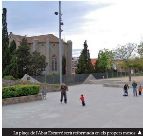
La plaça de l'Abat Escarré serà reformada en els propers mesos ▶

Dels gairebé set milions i mig d'euros que el Ple va acordar que seran per a diverses inversions, un milió vuit-cents mil es destinaran a realitzar millores i reformes en diverses escoles i instituts de la ciutat. Entre les obres incloses en el Pla d'actuació del mandat, corresponents a l'exercici del 2018, que seran finançades amb el romanent líquid de tresoreria resultant de la liquidació del pressupost del 2017 i que sumen un total de 3.429.447 €, calen destacar les que es faran a les escoles Mercè Rodoreda (253.357 €), Wagner (150.000 €), Serra de Marina (320.310 €), Pallaresa (50.000 €),