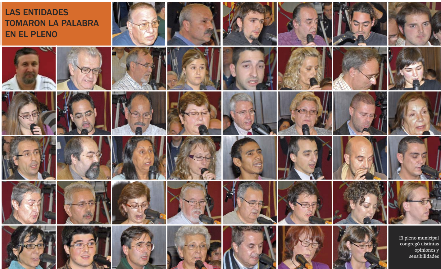
El pleno municipal congregó distintes opiniones y sensibilidades