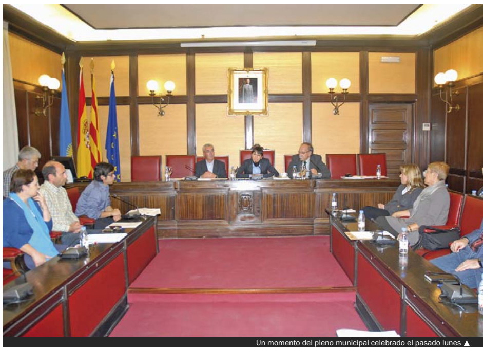
Un momento del pleno municipal celebrado el pasado lunes ▲

—La promoción de los mecanismos de consenso político mediante: la participación de los grupos de la oposición en la Junta de Govern Local en calidad de observadores; la promoción de acuerdos estratégicos