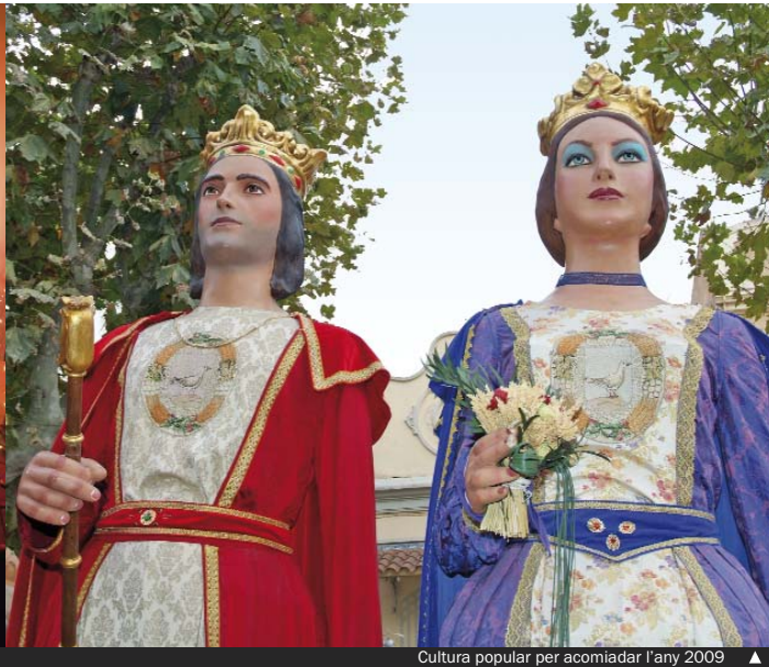
Cultura popular per acomiadar l'any 2009 ▲

continuarà pel carrer de Sant Carles i la plaça d'en Joan Manent. A la mateixa hora (19.00) comença la cercavila de la Colla de Gegants i Capgrossos, que sortirà des de l'església Major i recorrerà els carrers de Mossèn Jaume Gordi, Rafael de Casanova, Anselm Clavé i plaça de la Vila.