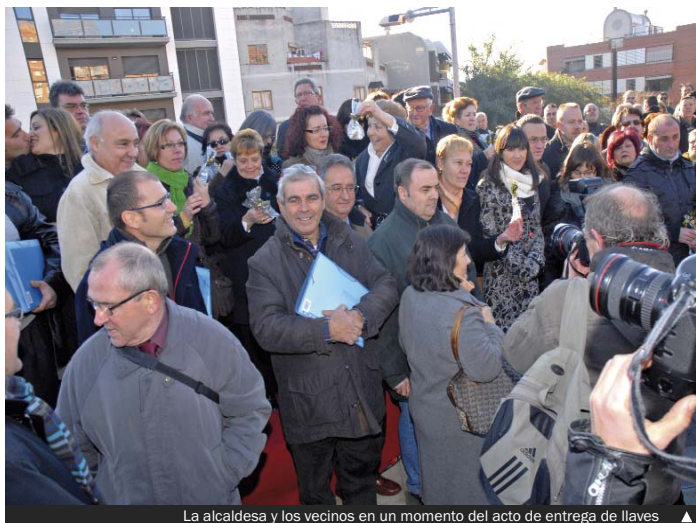
La alcaldesa y los vecinos en un momento del acto de entrega de llaves ▲

La imagen es un recuerdo de esta jornada, que deja también la huella de la gran capacidad solidaria de la ciudadanía de Santa Coloma.