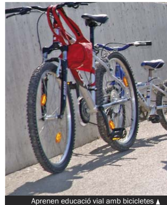
Aprenen educació vial amb bicicletes ▲

Les sessions tenen una durada d'una hora, amb vuit alumnes per grup que adquireixen hàbits de comportament i prudència que s'espera els ajudin a fer front a diferents situacions de seguretat viària i de conducta ciutadana, en el més ampli sentit de la paraula. Així, mitjançant la simulació, s'assoleixen uns coneixements elementals sobre normes i senyals de trànsit.