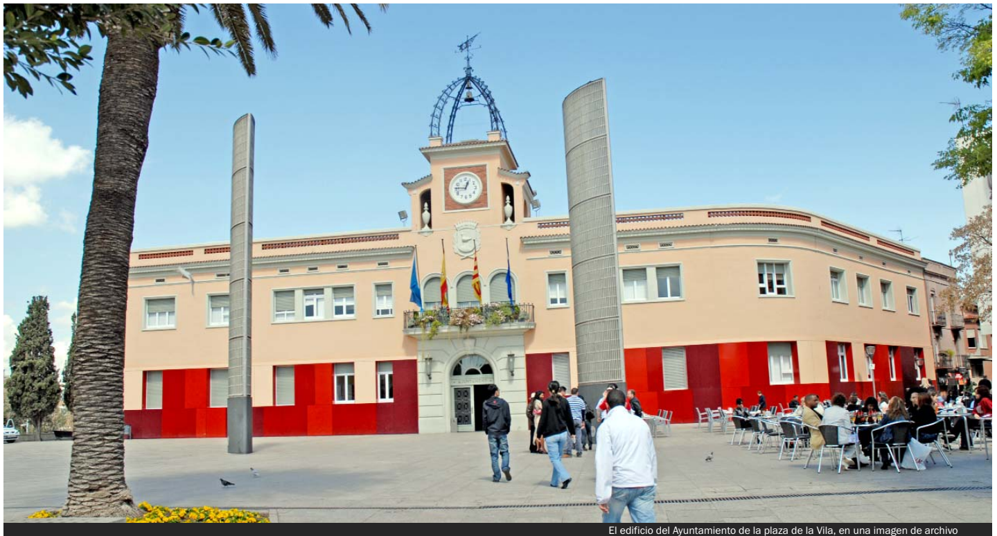
El edificio del Ayuntamiento de la plaza de la Vila, en una imagen de archivo

► El día 27 de octubre se desarrolló una investigación por parte de la Audiencia Nacional en el Ayuntamiento de Santa Coloma de Gramenet, la cual forma parte, parece, de una investigación judicial más amplia.