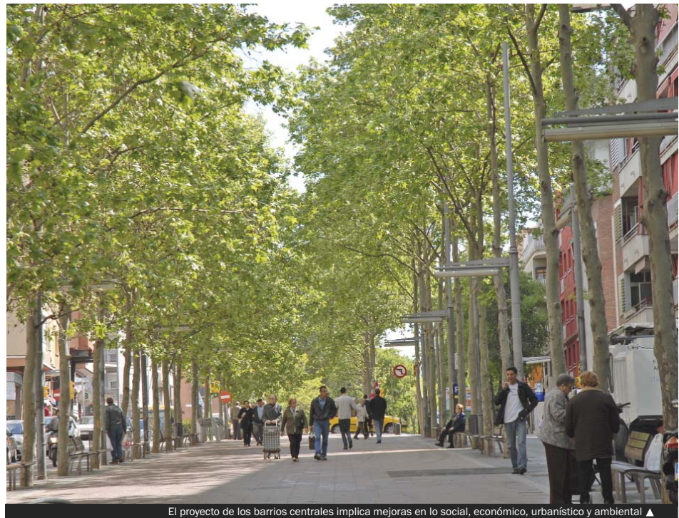
El proyecto de los barrios centrales implica mejoras en lo social, económico, urbanístico y ambiental ▲

Los proyectos inciden de manera especial en la mejora de la ocupación, en el desarrollo de programas formativos de calidad y de capacitación laboral, además de incluir actuaciones que benefician la conciliación de la vida laboral y familiar. En este ámbito,