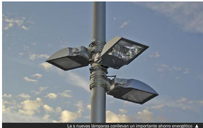
Las nuevas lámparas conllevan un importante ahorro energético ▲

A lo largo de la segunda quincena de octubre, el Ayuntamiento comenzará la instalación de luces de tecnología LED en el pavimento de las rotondas de Can Peixauet y de Santa Rosa. Se trata de una experiencia piloto que tendrá continuidad más tarde en todas las rotondas de la ciudad.