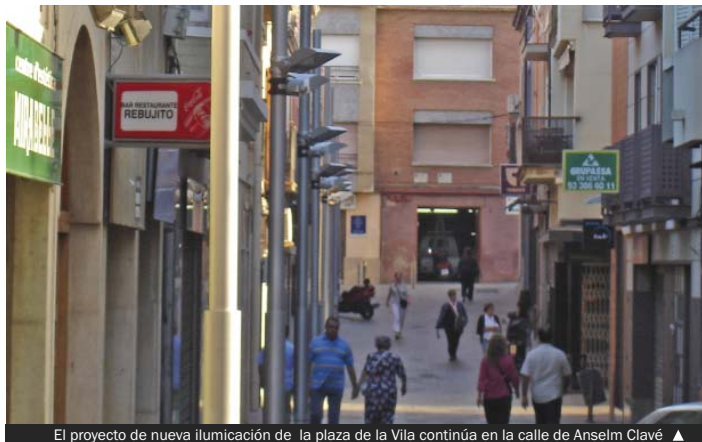
El proyecto de nueva iluminación de la plaza de la Vila continúa en la calle de Anselm Clavé ▲

Nuevas luminarias en Anselm Clavé y Sant Carles