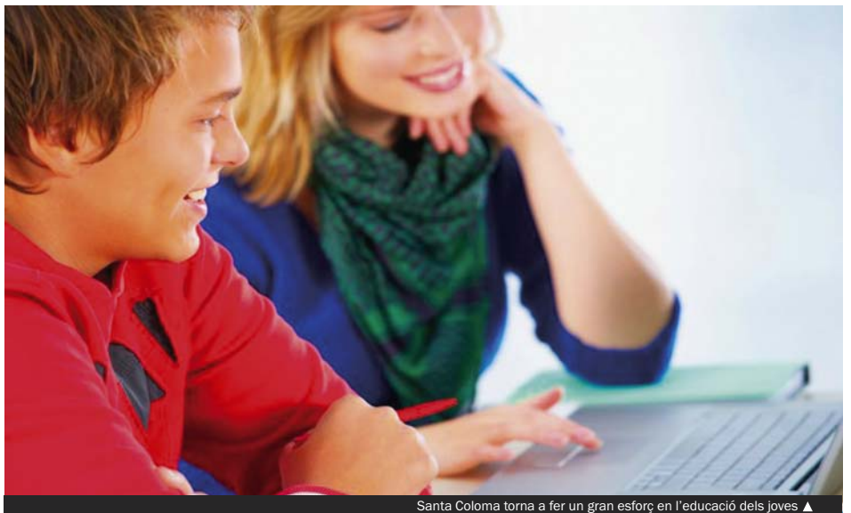
Santa Coloma torna a fer un gran esforç en l'educació dels joves ▲