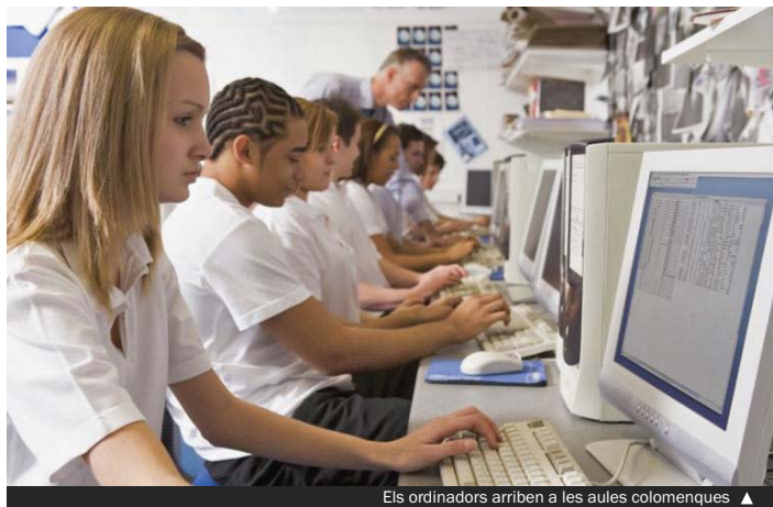
Els ordinadors arriben a les aules colomenques ▶

Una altra de les operacions que caldrà fer amb tots els ordinadors serà registrar-los en el sistema de monitoratge i antifurt, atès que tots els ordinadors estaran protegits i controlats per l'administració educativa.