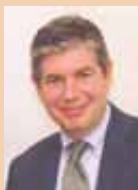
Bartomeu Muñoz i Calvet, Alcalde de Santa Coloma de Gramenet.

Los meses centrales del verano son el puente que enlaza el final de un curso y el principio de otro. Todos, tanto en el ámbito laboral como en el escolar, nos regimos por este calendario. Se trata de dos meses para cambiar las rutinas, para dedicarse a actividades distintas a las habituales, para compartir y para descansar. Un año más, desde el Ayuntamiento de Santa Coloma y desde el tejido de asociaciones y entidades, se ha diseñado un amplio programa con propuestas que quieren satisfacer a todos. Música, cine, teatro, talleres diversos, excursiones, deporte, piscinas... Una amplia oferta lúdica y cultural al alcance de todos los colomenses. Pero las vacaciones sirven también para reforzar el sentido de ciudadanía y de vecindad, para compartir los espacios comunes que la ciudad nos ofrece y para descubrir aquellos de nueva creación o de reurbanización reciente. Vivamos la ciudad, compartámosla y que este sea un gran verano para todos.