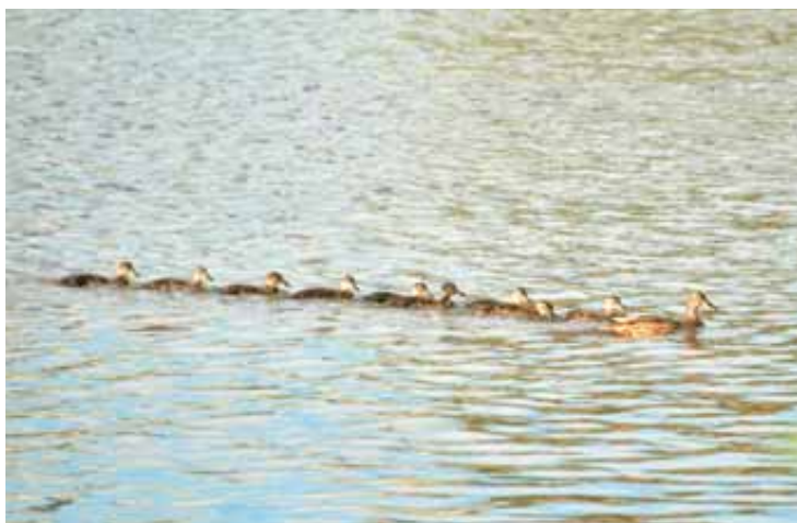
PATOS EN EL BESÓS. La regeneración de las aguas del Besòs ha provocado algunas imágenes impensables hace unos años. Como la de esta familia de patos que han hecho del parque fluvial su hábitat natural. La foto fue tomada junto al puente de Can Peixauet, y la bandada causó la admiración de muchos ciudadanos que siguieron sus evoluciones durante días.