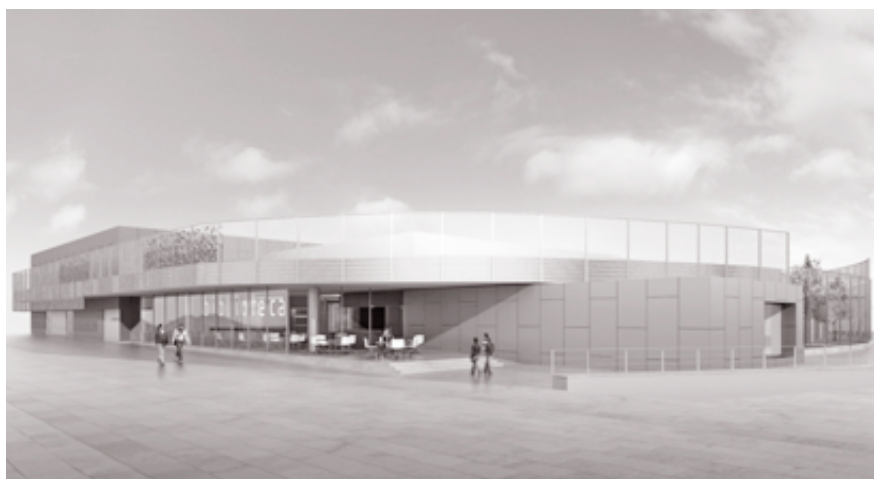
Imagen virtual de la biblioteca de Singuerlín, equipamiento que abrirá sus puertas en el último trimestre del año.