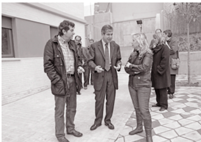
El alcalde, durante la visita al CEIP Unamuno, con el director y la presidenta de la AMPA.