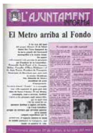
Estas dos portadas de L'Ajuntament Informa recogen la llegada del metro a la plaza de la Vila (1983) y al Fondo (1992), hechos de gran significado histórico para la ciudad.

En 1983 se logró superar una barrera que parecía infranqueable para la llegada del metropolitano a nuestra ciudad: el río Besòs