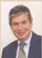
Bartomeu Muñoz i Calvet Alcalde de Santa Coloma de Gramenet

El desarrollo de Santa Coloma de Gramenet, su progreso y el incremento del bienestar social son cuestiones que están estrechamente ligadas al hecho de ser capaces de mejorar la movilidad de nuestros ciudadanos: Una movilidad interior, doméstica, que conecte los distintos barrios de la ciudad y acerque los equipamientos y los servicios a todas las personas; y otra movilidad, la regional, que es una pieza clave para la vertebración metropolitana. El metro llegó a Santa Coloma hace ahora 25 años. Ahora estamos ante otro hito histórico, la entrada en servicio, dentro de pocos meses, de la nueva línea 9 del metro. Se trata de un logro estratégico para la ciudad por diversos motivos. Por un lado, fortalece la conectividad con el resto del Barcelonès y nos acerca a grandes infraestructuras metropolitanas, como el tren o el aeropuerto. Por otro lado, las seis estaciones previstas en Santa Coloma generarán una red interior de transporte que, junto a la potente dotación de escaleras mecánicas que estamos instalando, producirá un verdadero salto cualitativo en la mejora de la movilidad de las personas y acercará nuestros barrios a todos los servicios de la ciudad. Además, las obras de la línea 9 comportan la reurbanización del entorno de las estaciones de metro, dando lugar a nuevas plazas para el uso ciudadano y aportando importantes mejoras en el espacio público.