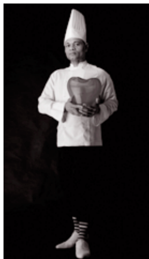
Sisteré es troba al carrer de Sant Carles, s/n (tel. 93 385 13 12).