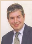
Bartomeu Muñoz i Calvet. Alcalde de Santa Coloma de Gramenet.

En Santa Coloma de Gramenet no puede hablarse de comercio como una realidad económica aislada. El importante papel social y de cohesión ciudadana que este sector protagoniza merece actuaciones más globales y ambiciosas. Es por ello que los numerosos proyectos de transformación y modernización de nuestros barrios, que está llevando a cabo el gobierno municipal —el urbanismo, las comunicaciones, la renovación paulatina del parque de viviendas o la más eficaz gestión energética y medioambiental— piensan en el comercio como un elemento estratégico del desarrollo de la ciudad. Por su parte, tanto la ACI como las agrupaciones comerciales vienen realizando acciones de dinamización sectorial y de promoción que redundarán en un comercio cada vez más competitivo y eficaz ante las necesidades de consumo de los colomenses.