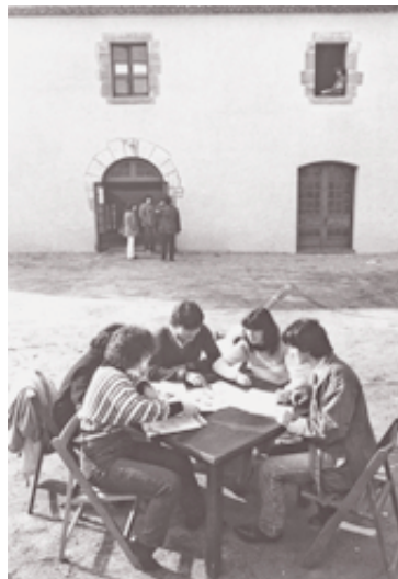
Imatge d'arxiu del pati del Mas Fonollar en els seus inicis com a centre juvenil.